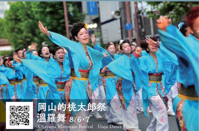
岡山的桃太郎祭 溫羅舞 8/6-7 Okayama Momotaro Festival Uraja Dance Parade