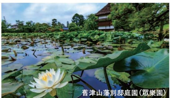
舊津山藩別邸庭園(歌樂園)

西日本露天溫泉首選的溫泉旅館 In the category of outdoor hot spring, it is ranked to be the solid champion of Western Japan.