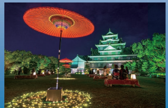
夏日的鳥城燈源鄉 2016/8/1~8/31 Lamp-lit crow castle in summer