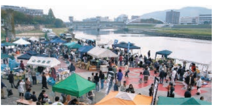
備前岡山京橋朝市 Kyoubashi morning markets of Bizen, Okayama 每月的第一個禮拜日舉行的早市 Kyobashi morning market is open on the 1st Sunday of the month.