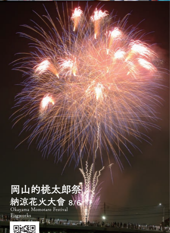
岡山的桃太郎祭 納涼花火大會 8/6 Okayama Momotaro Festival Fireworks