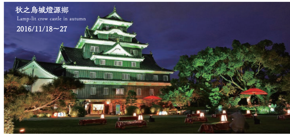
秋之烏城燈源鄉 Lamp-lit crow castle in autumn 2016/11/18~27