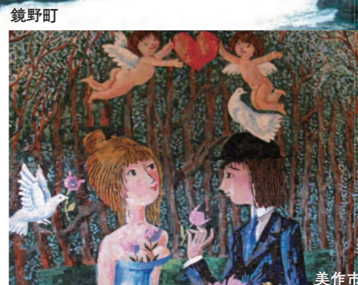
美作市作東美術館 Mimasaka-city Sakuto Museum 展示Raymond Peynet描寫戀人間愛情的作品。羅丹貴重的雕刻作品也值得一看。 Exhibitions of arts of Raymond Peynet who painted lovers' affection. You don't want to miss Rodin's precious sculpture "Orpheus"