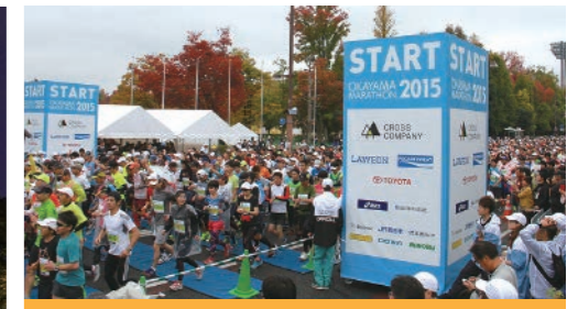
岡山馬拉松2016 OKAYAMA MARATHON 2016 2016/11/13sun. 16,000人的參賽者奔馳在晚秋的山岡街道上 16,000 people run on the road in Okayama in later autumn.