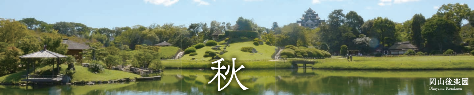
岡山後樂園 Okayama Korakuen

★★★★ Mentioned in Michelin Green guide Japan, Lonely Planet Japan 日本三大名園之一 One of the three great gardens of Japan 岡山後樂園 Okayama Korakuen 被指定為國家的特別名勝古蹟 It is selected as a national scenic reserve.