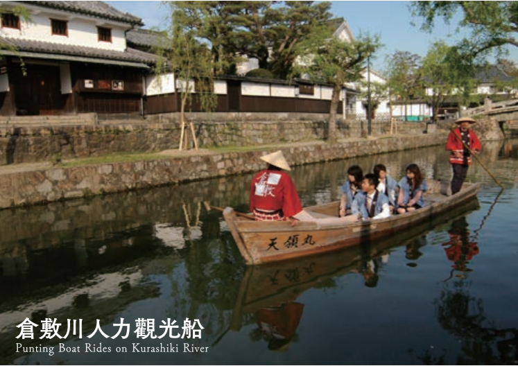
倉敷川人力觀光船 Punting Boat Rides on Kurashiki River