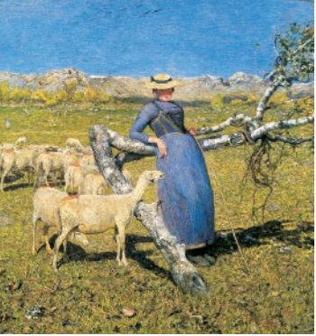
喬凡尼·塞根迪尼「High Noon in the Alps」 (大原美術館藏) SEGANTINI, Giovanni「High Noon in the Alps」