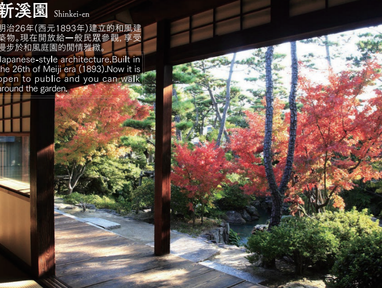
新溪園 Shinkei-en 明治26年(西元1893年)建立的和風建築物。現在開放給一般民眾參觀,享受漫步於和風庭園的閒情雅緻。 Japanese-style architecture. Built in the 26th of Meiji era (1893). Now it is open to public and you can walk around the garden.