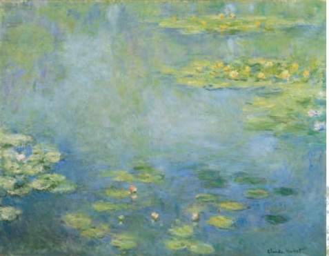
莫內「睡蓮」(大原美術館藏) MONET, Claude「Waterlilies」

日本首現的私立西洋近代美術館 One of the first museums in Japan, that exhibited both European and modern art.