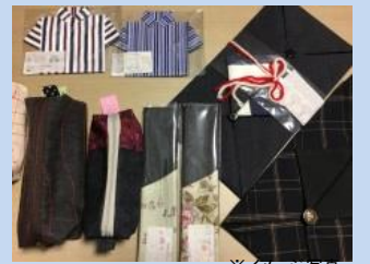
県立倉敷琴浦高等支援学校 「デニム製品の販売」