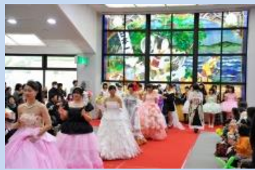
県立興陽高等学校 「被服デザイン科3年生による ファッションショー」

☆家庭部門☆ 興陽高校ファッションショー 10時30分～ 琴浦支援学校販売時間 10時～16時