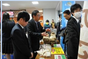
県立高梁城南高等学校 「鍋やみそ汁、焼いてもおいしい ホホワイトヒラタケの販売」