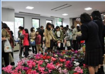
県立高松農業高等学校 「季節の花・寄せ植え等の販売」