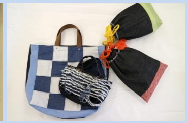
県立倉敷工業高等学校 ファッション技術科 「デニム作品の展示」