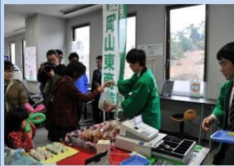
県立岡山東商業高等学校 県立津山商業高等学校 「高校生が開発したオリジナル商品を多数販売」