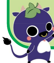
新見市マスコットキャラクター にーみん